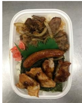
(ビーフ 、 から揚げ 、ウインナー)