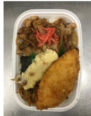
(しょうが焼き、白身フライ 、チクワ天)